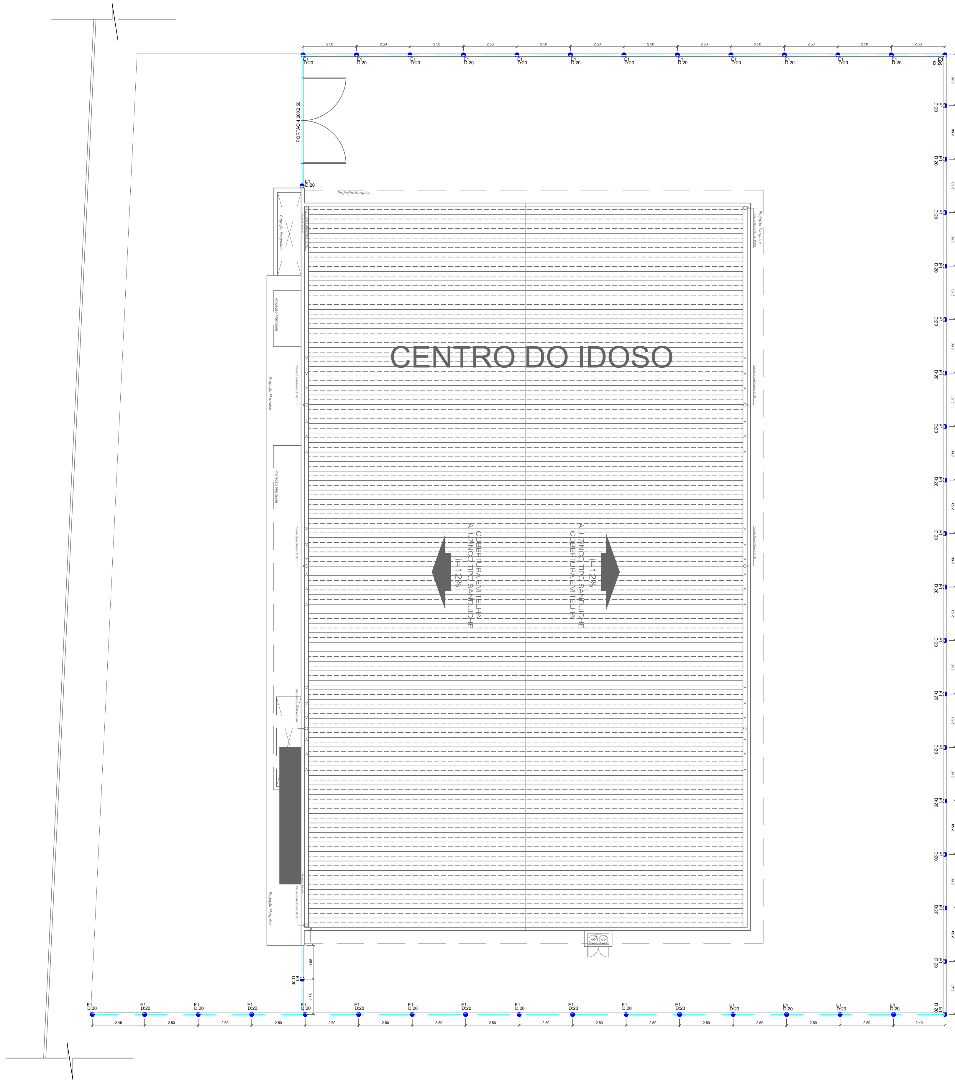
PLANTA DE LOCAÇÃO DAS ESTACAS ESCALA 1:100